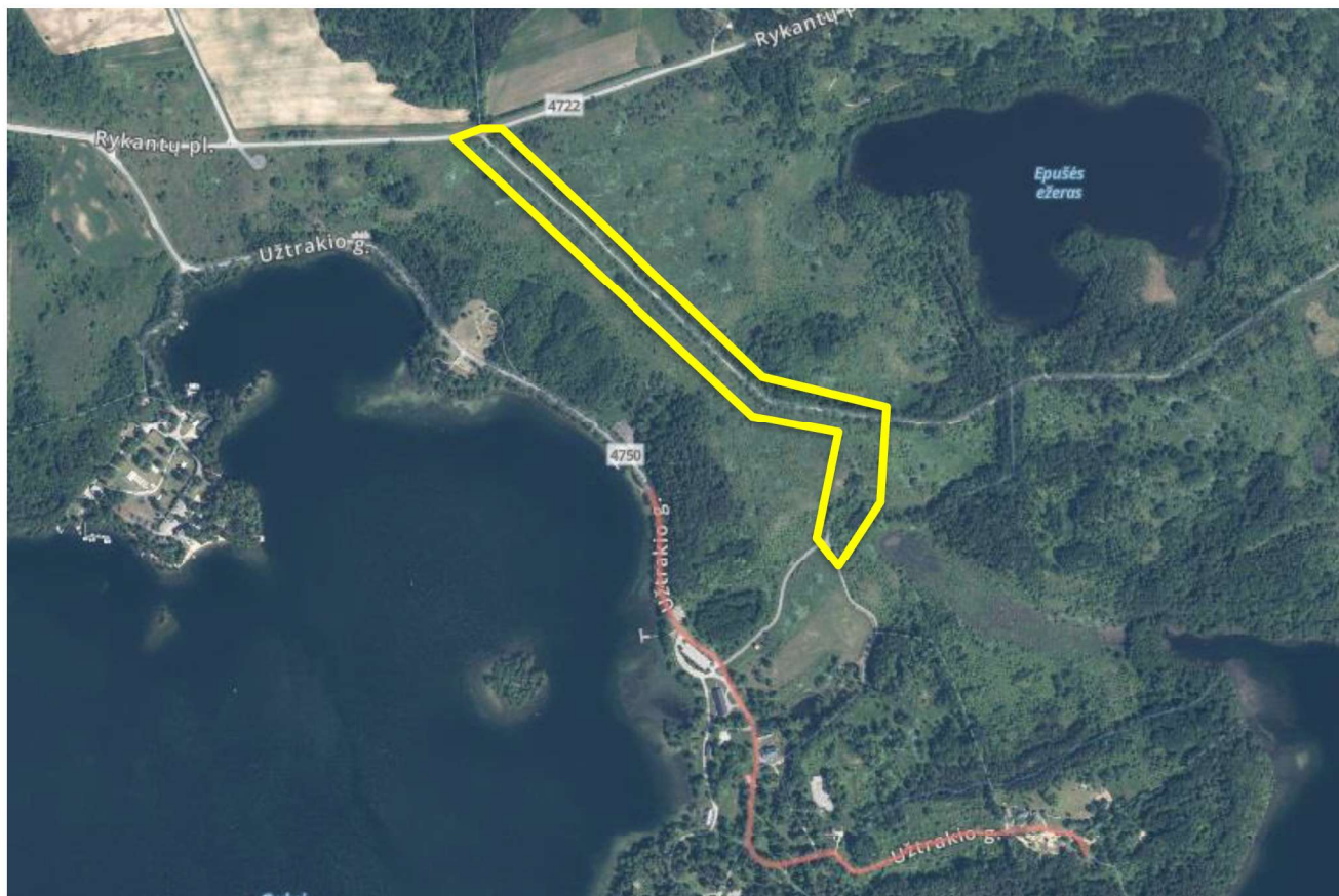
Ekspertuojamų želdinių vieta

Teritorija nepriklauso TINP (Trakų Istorinio Nacionalinio parko) direkcijai nuosavybės forma, tai laisva valstybinė žemė, bet patenka į TINP saugomą teritoriją