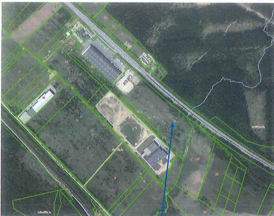
I pav. Situacijos schema. Nagrinėjamas sklypas

Detalusis planas įregistruotas LR teritorijų planavimo dokumentų registre, Nr. T00043308.